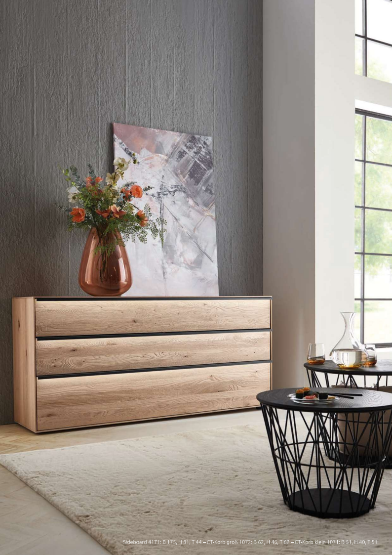
Sideboard 4171: B 175, H 81, T 44 – CT-Korb groß 1072: B 62, H 46, T 62 – CT-Korb klein 1071: B 51, H 40, T 51