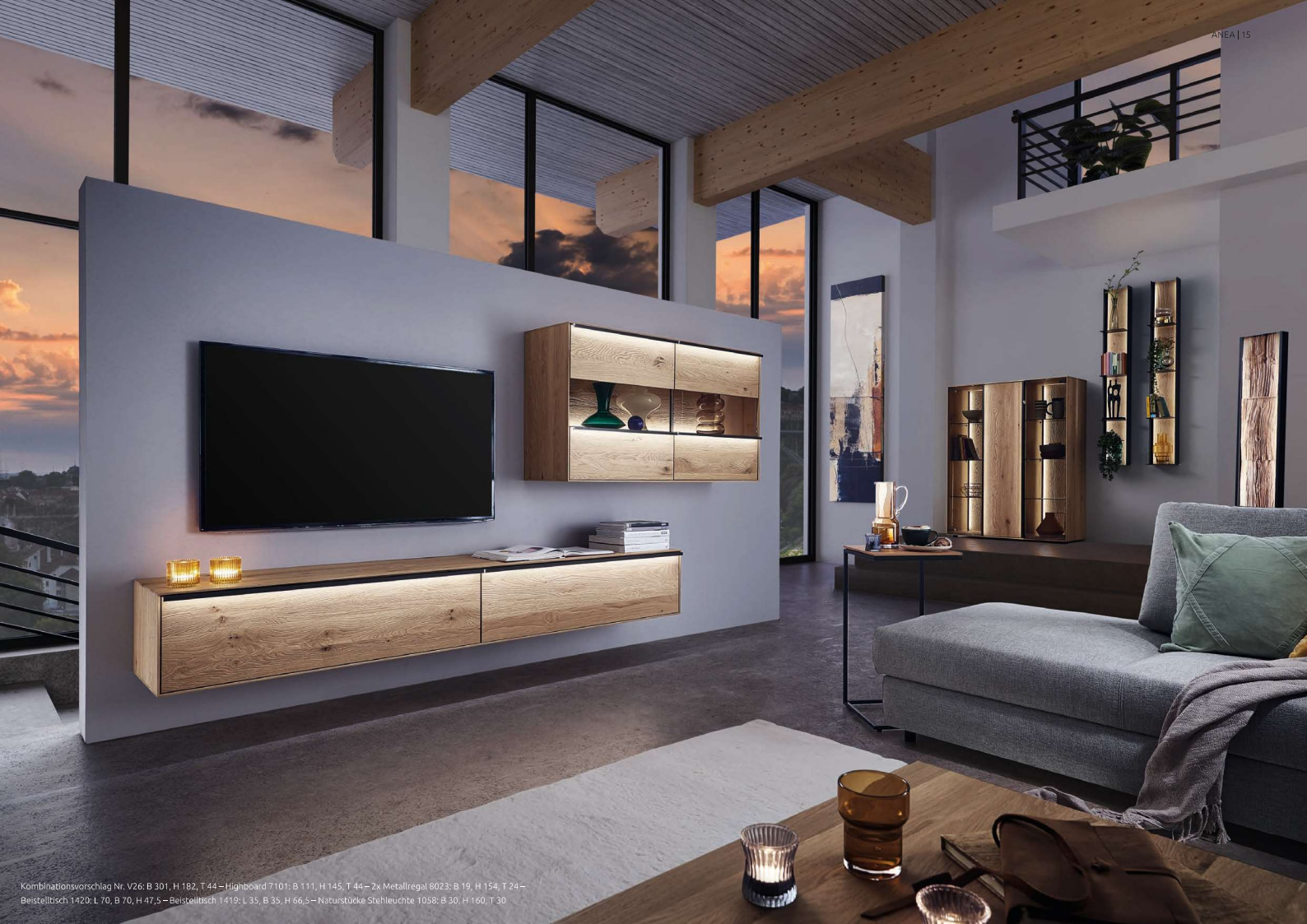
Kombinationsvorschlag Nr. V26: B 301, H 182, T 44 – Highboard 7101: B 111, H 145, T 44 – 2x Metallregal 8023: B 19, H 154, T 24 – Beistelltisch 1420: L 70, B 70, H 47,5 – Beistelltisch 1419: L 35, B 35, H 66,5 – Naturstucke Stehleuchte 1058: B 30, H 160, T 30