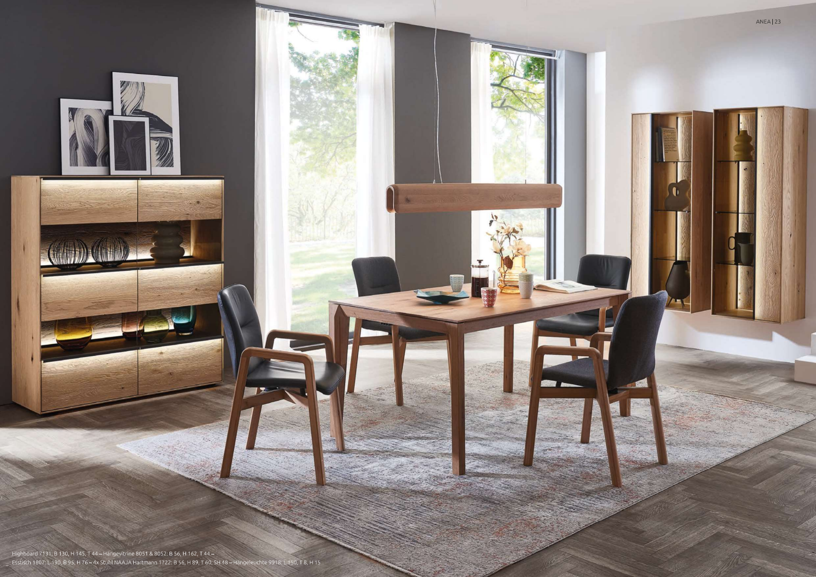
Highbord 7131: B 130, H 145, T 44 – Hängevitrine 8051 & 8052: B 56, H 162, T 44 – Esstisch 1807: L 190, B 95, H 76 – 4x Stuhl NAAJA Hartmann 1722: B 56, H 89, T 60, SH 48 – Hängeleuchte 9918: L 150, T 8, H 15