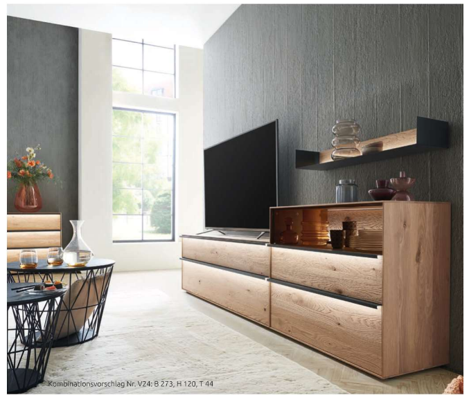
Kombinationsvorschlag Nr. VZ4: B 273, H 120, T 44