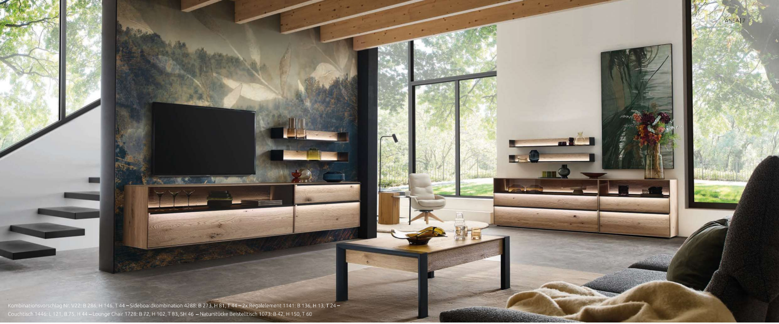
Kombinationsvorschlag Nr. V22: B 286, H 146, T 44 – Sideboardkombination 4288: B 273, H 81, T 44 – 2x Regalelement 1141: B 136, H 13, T 24 – Couchtisch 1446: L 121, B 75, H 44 – Lounge Chair 1728: B 72, H 102, T 83, 5H 46 – Naturstücke Beistelltisch 1073: B 42, H 150, T 60