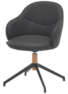
Stuhl RICO Hartmann 1719: B 61, H 84, T 63, SH 50

Der Stuhl Rico überzeugt durch sein stilvolles Design und erfüllt einen wertvollen ergonomischen Nutzen, indem er das gesunde Sitzen fördert. Ähnlich wie bei einem Gymnastikball hält Sie die Elastic-Aktiv-Federung ständig in Bewegung, entlastet damit die Bandscheiben und verbessert die Durchblutung. Zudem trainieren die Mikrobewegungen Ihre Rückenmuskulatur, beugen dadurch Haltungsschäden vor und schonen so Ihren Rücken.