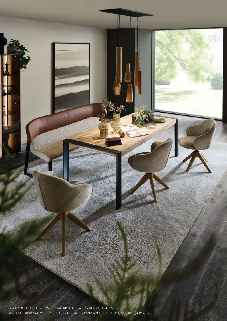
Esstisch 1803: L 190, B 95, H 76 – 3x Stuhl RICO Hartmann 1718: B 61, H 84, T 63, SH 51 – Bank LANA Hartmann 1696: B 190, H 90, T 71, SH 48 – Pendelleuchte 9910: Ø 8/11/12 H 30/35/43/57/65