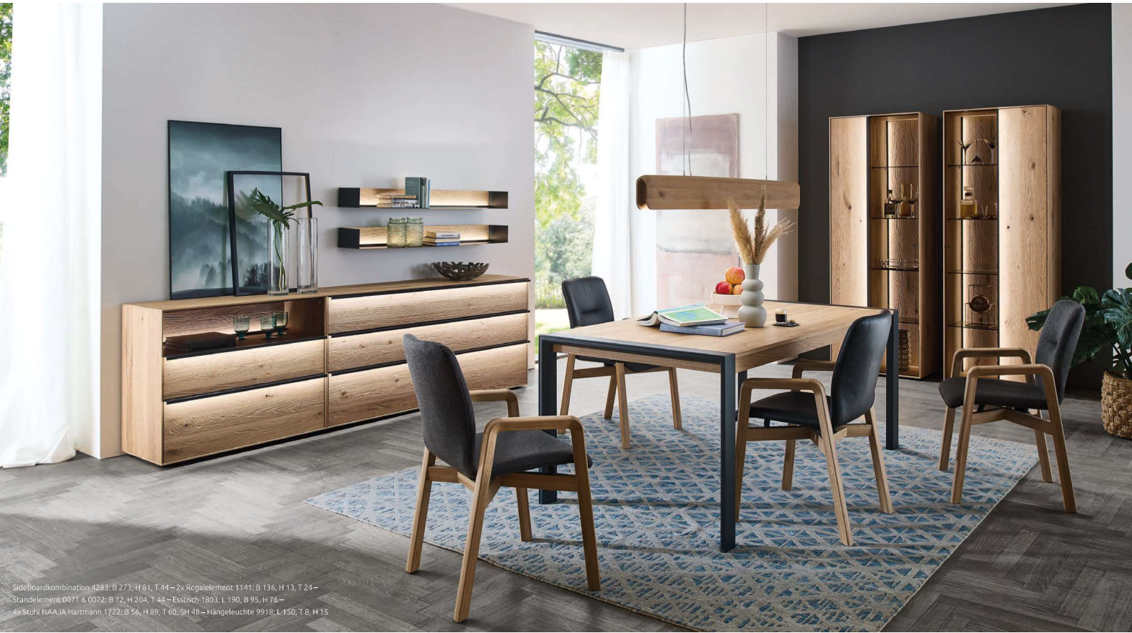
Sideboardkombination 4283: B 273, H 81, T 44 – 2x Regalelement 1141: B 136, H 13, T 24 – Standelement 0071 & 0072: B 72, H 204, T 44 – Esstisch 1803: L 190, B 95, H 76 – 4x Stuhl NAAJA Hartmann 1722: B 56, H 89, T 60, SH 48 – Hängeleuchte 9918: L 150, T 8, H 15