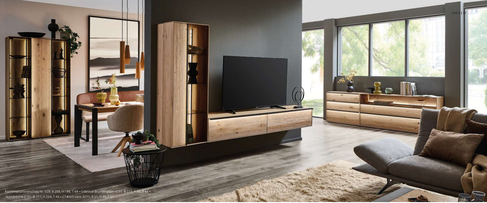
Kombinationsvorschlag Nr. V28: B 289, H 198, T 44 – Sideboard/Combination #289: B 273, H 81, T 44 – Standtreppe 0101: B 111, H 204, T 44 – CT-Korb Klein 1071: B 51, H 40, T 51