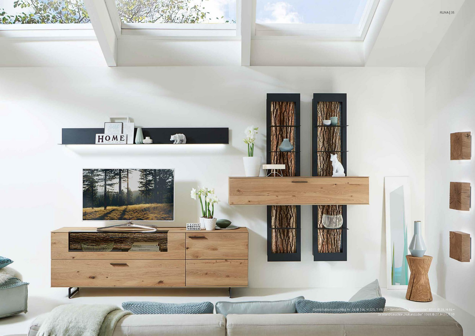
Originalensvorne Maß: Nr. 25, B 346, H 225, T 49/70 – Bestellloch „Naturstücke“ 1011: Ø 28, H 45 – 3x Wand-Leuchte „Naturstücke“ 1061: B 27, H 27, T 10