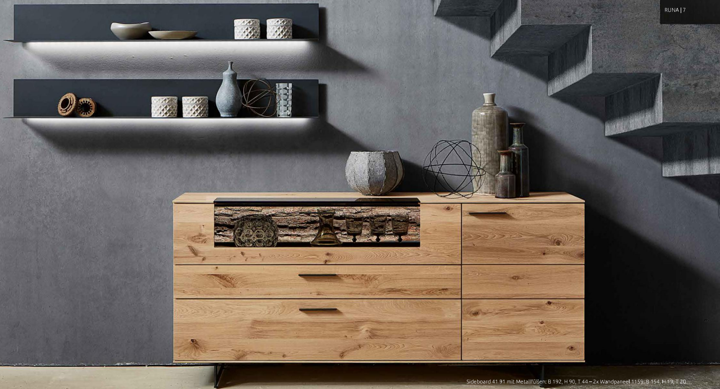
Sideboard 41 91 mit Metallfüßen: B 192, H 90, T 44 – 2x Wandpaneel 11 59: B 154, H 19, T 20.