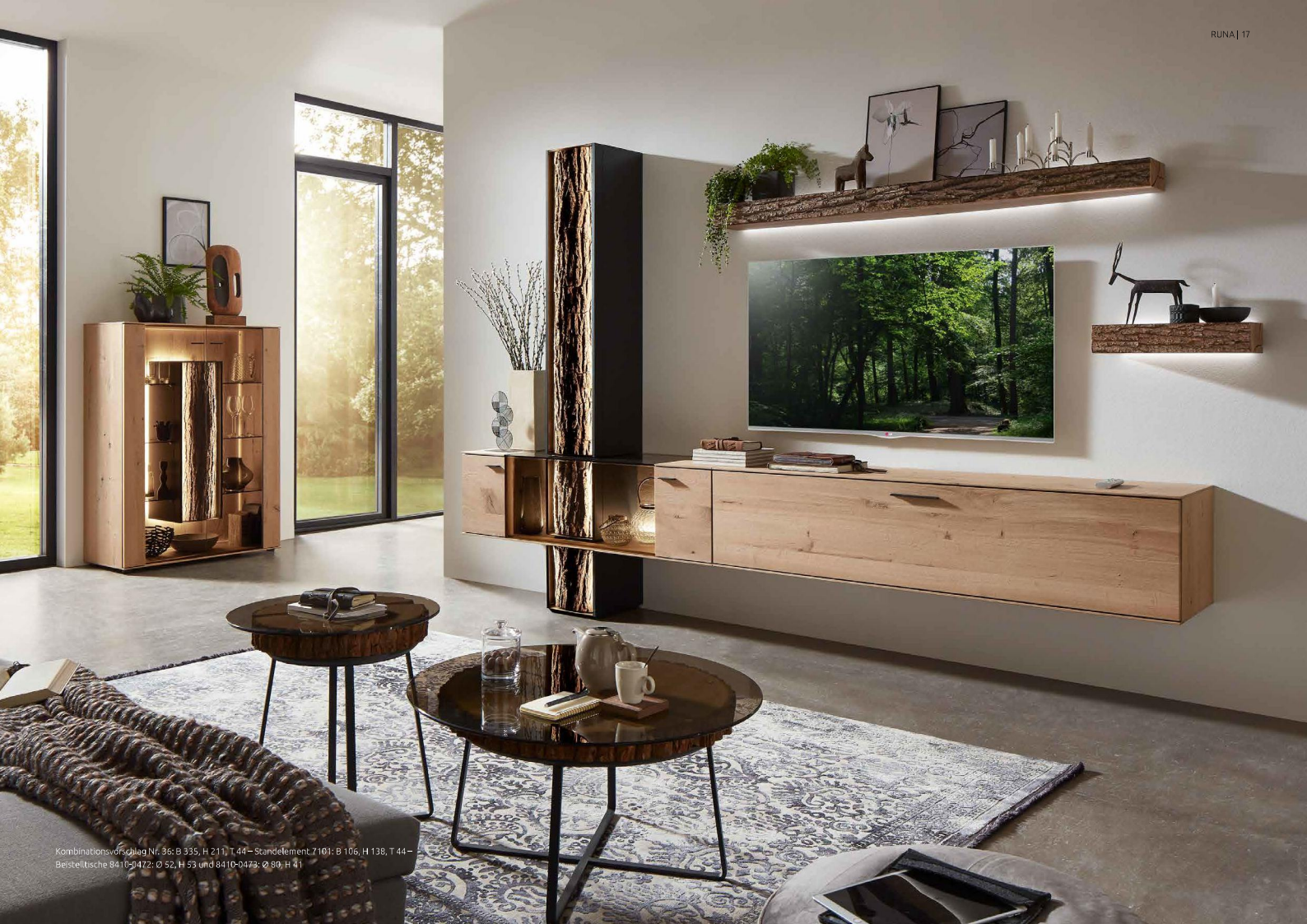
Kombinationsvorschlag Nr. 36: B 335, H 211, T 44 – Standelement 710: B 106, H 138, T 44 – Beistelltische 8410-0472: Ø 52, H 53 und 8410-0473: Ø 89, H 41