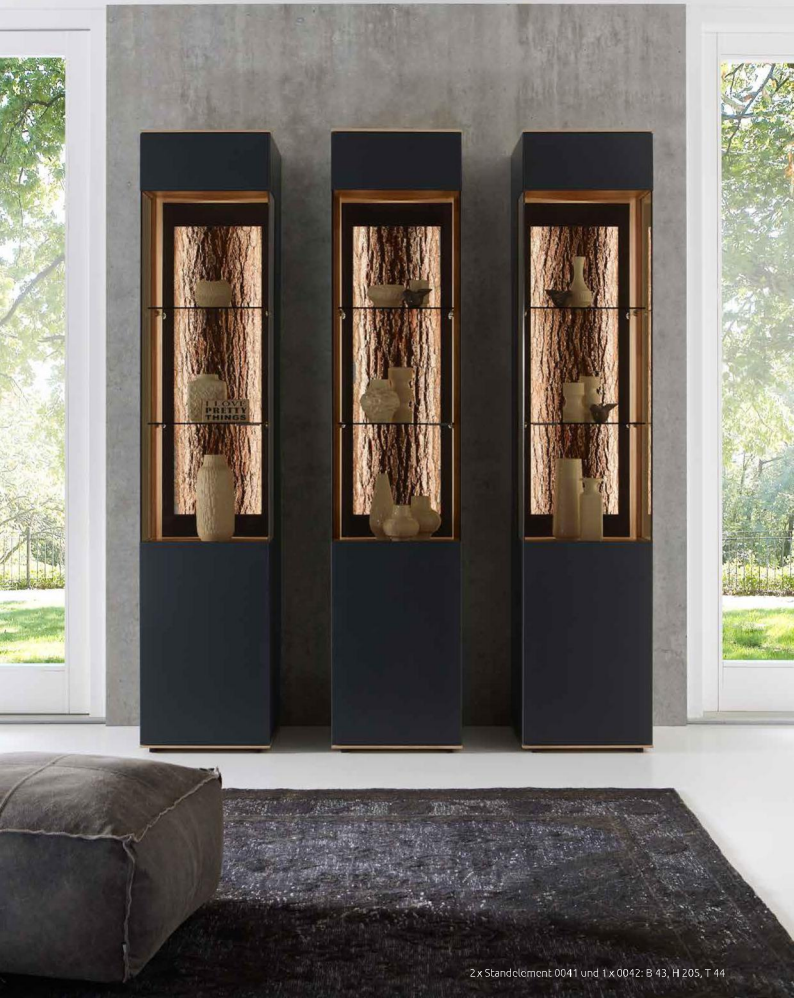
2x Ständelement 0041 und 1x 0042: B 43, H 205, T 44