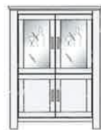
Art.-Nr. -09-B Vitrine, halbhoch 2 Gl.T, 2 T