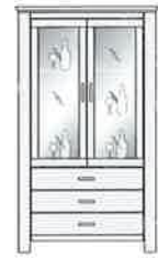
Art.-Nr. -08 Doppelvitrine