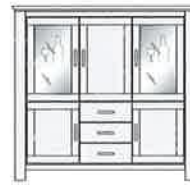
Art.-Nr. -07 Highboard, 2 Gl.T, 3 T, 3 SK