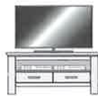
Art.-Nr. -11 Lowboard, 1 Fach 2 SK