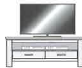
Art.-Nr. -11-G Lowboard, 1 Fach 2 SK