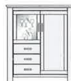
Art.-Nr. -28 Brotschrank