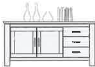
Art.-Nr. -05 Sideboard, 2 T - 3 SK